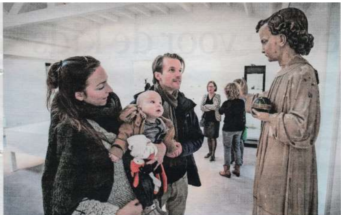
▲ Buurtbewoners nemen een kijkje in het nieuwe Princenhaags Museum.